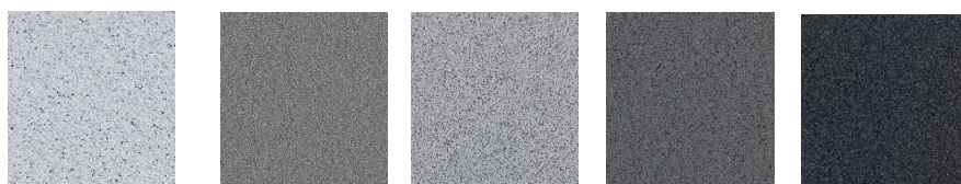
Beach Stone 11