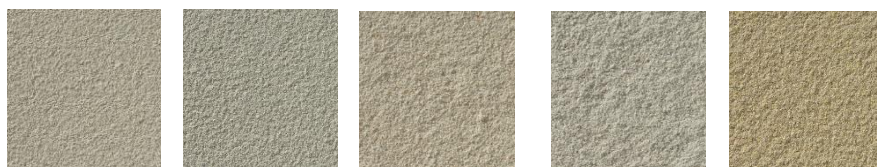
Castle Gray 101